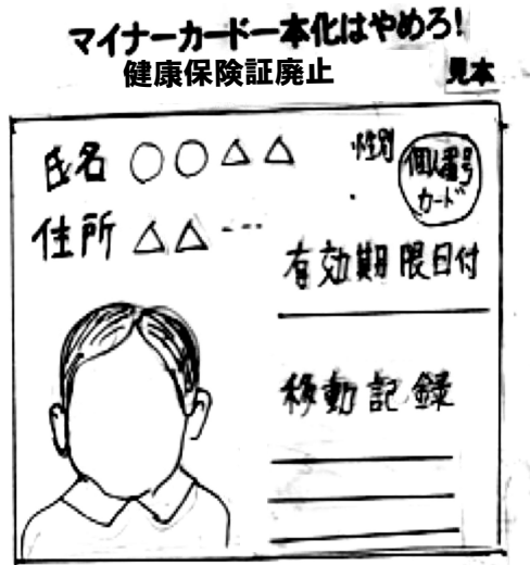
マイナーカード一本化はやめろ! 健康保険証廃止 見本

翌日は句碑「胎内の動き知るころ骨(コツ)がつき」があり、我が故郷の岐阜の先輩神山征二郎監督の映画「鶴彬こころの軌跡」の製作宿舎で、自民党の「野中広務氏」など多様な人の