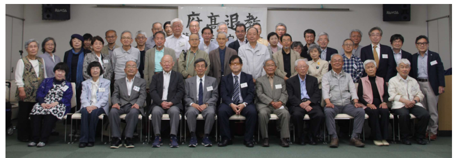
2023年5月21日 府高退教第33回定期総会

討論では5人の方が発言。「決算」を承認し、「予算案」「活動の歩みと基本」を採択。「私たちは今、戦争か平和かの歴史的な岐路に立っています」との文で始まる総会決議を採択しました。