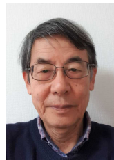
このような困難な中

明けましておめでと うございます。コロナ 年で結成30年を迎え 禍で例年とはちがった 年末・年始を迎えられ た会員の方も多かった のではないのでしょうか。 です。