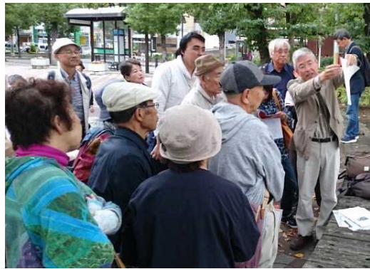
森田さんの説明を聞く参加者