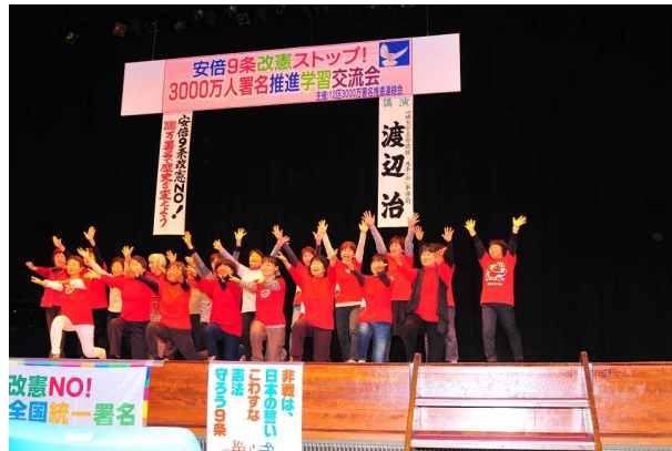
前列左から二人目、少し太めが私です。

ピンと合っています。行動力に敬意を表します。一〇〇〇の評論より一の行動が好きです」というメールが届きました。実は寝屋川の女性の「三〇〇〇〇万署名もりあげ隊ダンス」におそろいの赤い服を着て私も参加したのです。明るく楽しい学習会になりました。参加者に感想を聞きながら、署名用紙を預けています。この学習会を力に、署名がんばります。