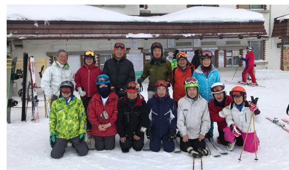
府高退教スキー 勢揃い